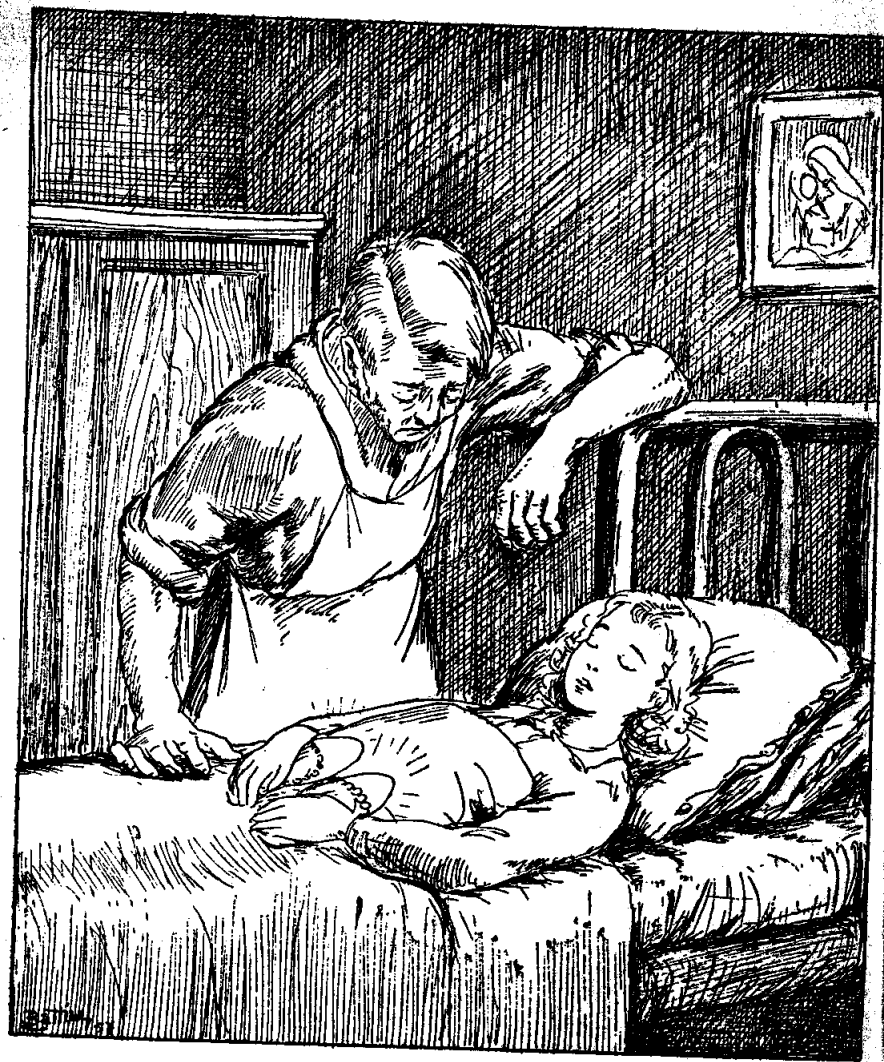
Մարիամ, հագիս, ելի՛ր, ոսկի սօլերդ հասամ...

քերը մեծ մեծ կը բանար ու դարձեալ խուփ կու տար, քարը տալով փոքրիկ դուխը յարդէ բարձին վրայ: