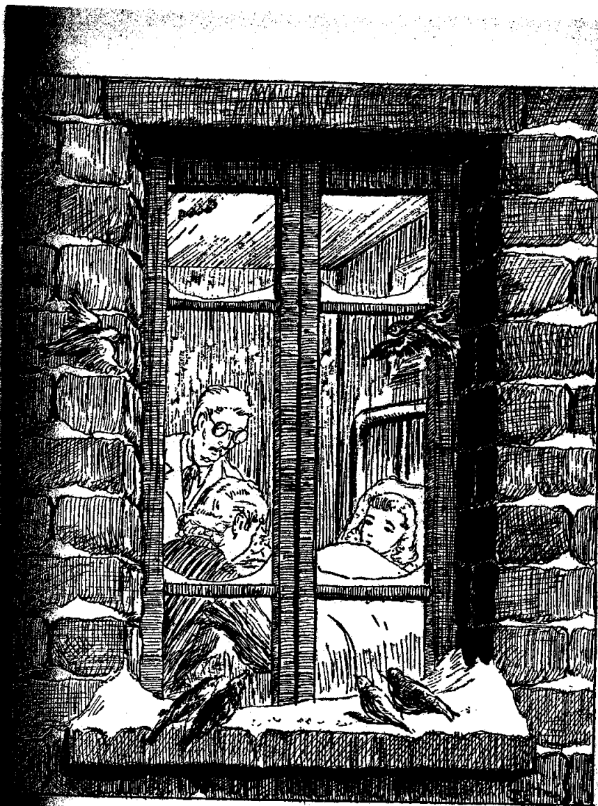
Տան մէջ անառնիս ունի՞ք, հարցուց բժիշկը ծնողքին...

Թռչունները շատ աւելի տխուր եւ ընկճուած էին քան թէ Մարիամին ծնողը. անոնք չէին հասկնար մարդկային ցաւերը. բժիշկը իրենց համար վախնալիք մարդ մըն էր: Ոչ մէկ ճիշտ հանեցին. ոչ մէկը առօրեայ թեան մասին կը խորհէր, լուռ կեցած՝ կ'ուզէին