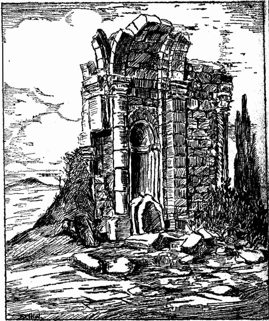
Աւերակներ ազդիմ, աւերակներ ամդիմ...

— Պապիկը իսկապէս չէ սխալած, Ախուրեանը Անիի գետն է, ըսաւ Սիսակ: