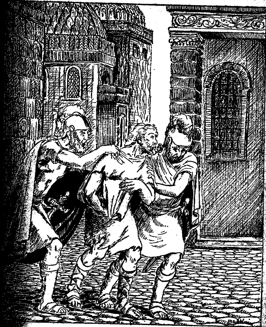
Երկու գիճուած մարդիկ վրան ինկան...

Թագուհին նախ ինքը համբուրեց խաչքարը եւ երեք