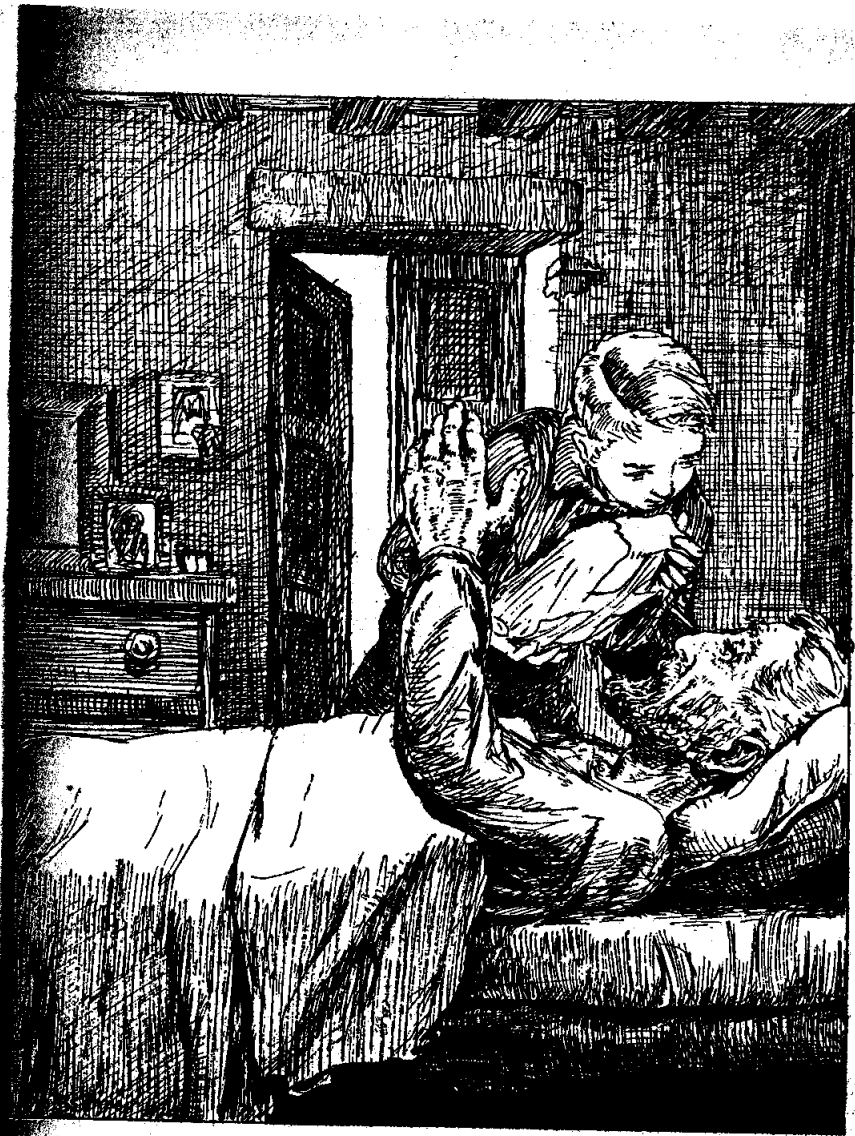
Պապի, ես եմ, Վահէն, ահա խաչքարը բերինք Անիէն...

Գեղամ եւ Միսակ լուռ կեցեր էին, անոնց սրտէն սարսուռ անցաւ երբ ծերունիին շրթներէն լսեցին սըրբազան ուխտ մը. Անին մերն է: