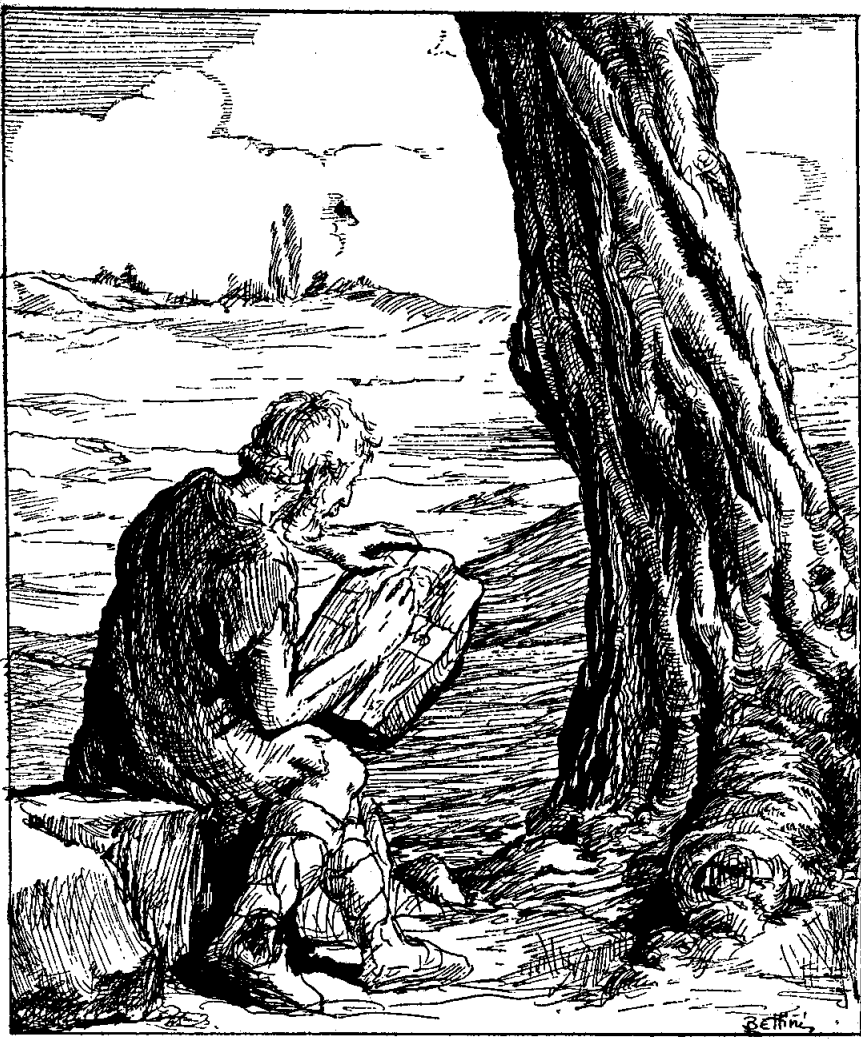
Նստաւ քարի մը վրայ եւ սկսաւ եզրօնգրեցնել փորձի...

— Օրհնեալ է Աստուած, պատասխանեց հովիւը, շարունակելով իր ճամբան: