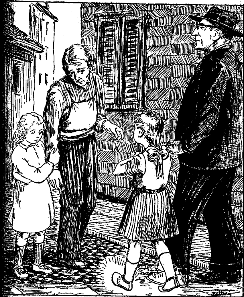
Հայրիկ, ես ալ ոսկի սօլեր կ'ուզեմ...

— Հայրիկ, ոսկի սօլեր կ'ուզեմ, կը կրկնէր անդադար: