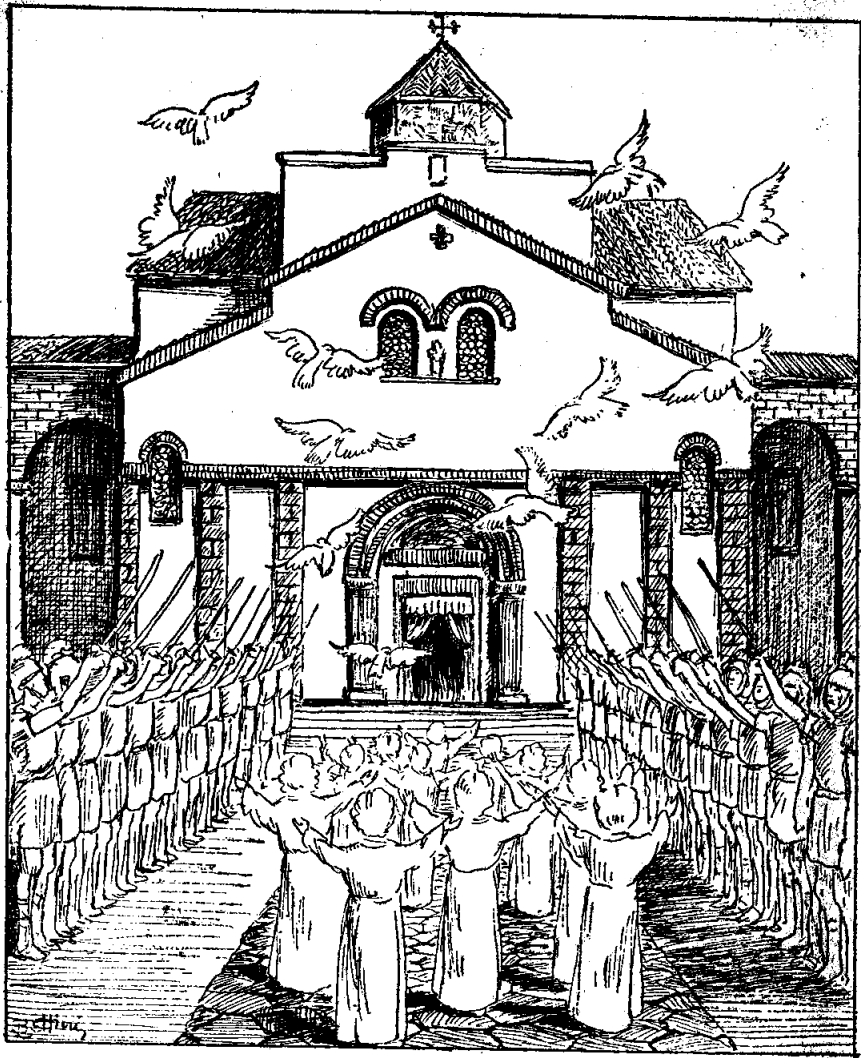
Մանուկները բաց քաղուցին սիրուն քաչուները...

Երեք փոքրիկները գացին եպիսկոպոսին. խնդիրք մը ունէին.