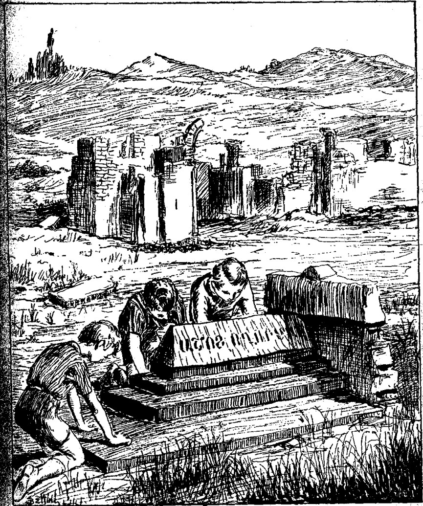
Երեքը միասին ծոեցան եւ հեգելով կարգացին ԱՇՈՏ ՈՂՈՐՄԱԾ