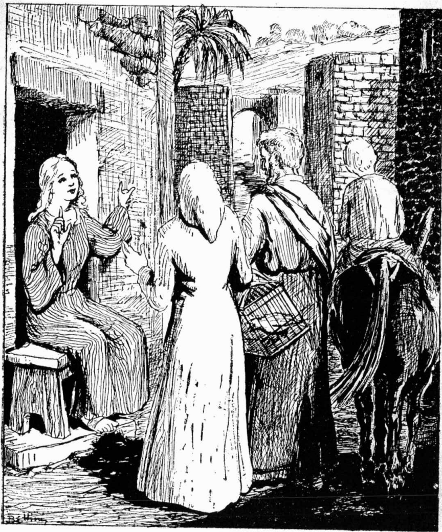
Նա բժշկեց կազեբը, կոյրերը, յարութիւն տուա մեռելներուն...

— Հիմա զինքն ո՞ւր կրնանք գտնել, հարցուց Միհրան: