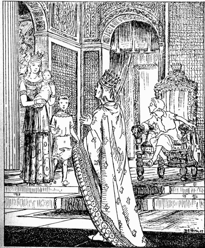
Տիկին մը ներս մտաւ, գիրկն առած նորածին մանուկ մը...

— Դարձեալ աղքատ մը գտար, ըսաւ թագաւորին, մեր պալատը աղքատանոց դարձուցիր :