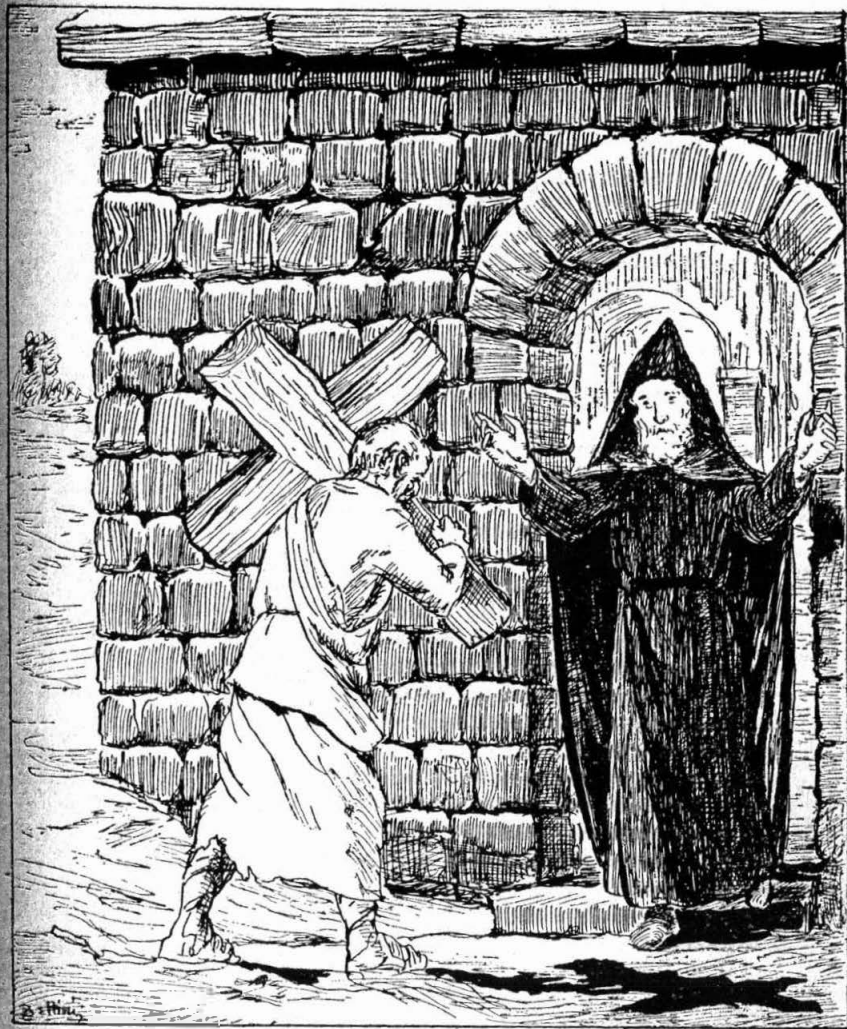
Սողոմոն վանահայրը տեսաւ գիւղացին խաչը ուսին...

— Եղբայր Պետրոս, ըսաւ օր մը Սարգիս վանականը, Տիրամօր պատիերը շինելու համար եղնիկի կաշի պէտք է, ոչխարինը շատ հաստ է, լաւ չ'ըլլար, ու մենք եղնիկի կաշի չունինք: