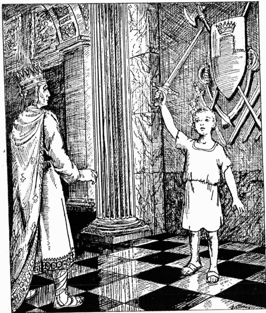
Թող յաւիտեան ապրի մեր բարի եւ քաջ թագաւորը...

եւ քաջ է. անթիւ զինուորներ ունի եւ Անին ալ իրեն կը պատկանի :