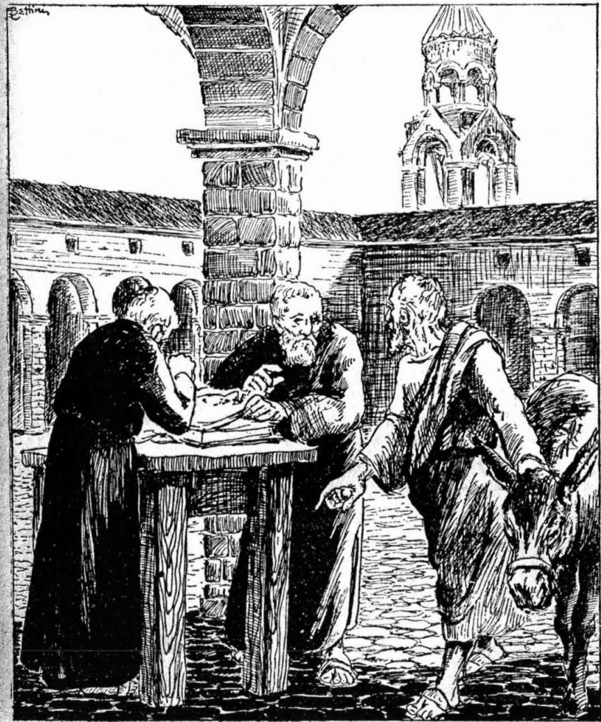
Մտաւ ուղղակի վանքին աշխատանոցը, էջն ալ միասին

— Ձէ, հայր սուրբ, տարիներով աշխատեցայ, այ- դի տնկեցի, խաղող քաղեցի, ցորեն ցանեցի՝ ոսկի հրն- ձեցի, տարի զանոնք Շուշի քաղաքը ծախեցի, եւ քանի մը ոսկի շահեցայ: Ոչխարներ ունէի սարերուն վրայ, մորթեցի հարիւր հատ, կաշին եւ առի՝ միւր վանքե- րուն եւ աղքատներուն բաժնեցի. եկած եմ հիմա խըն-