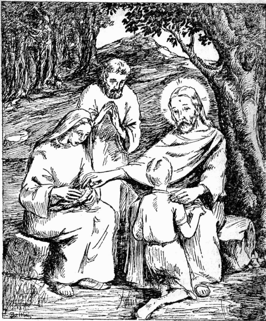
Հանց քոչունին աչքերն ու գետեղեց տղուն կոպերուն մէջ...

— Այո՛, ես եմ. ո՛վ որ զիս կը փնտռէ՝ միշտ պիտի գտնէ եւ լոյսն իրեն հետ յաւիտեան պիտի մնայ: