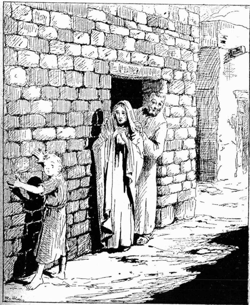
Պատերը շօշափելով դէպի դուռը գնաց լոյսը տեսնելու...

— Հոն ուղածդ կը գնենք, պատասխանեց Միհրան :