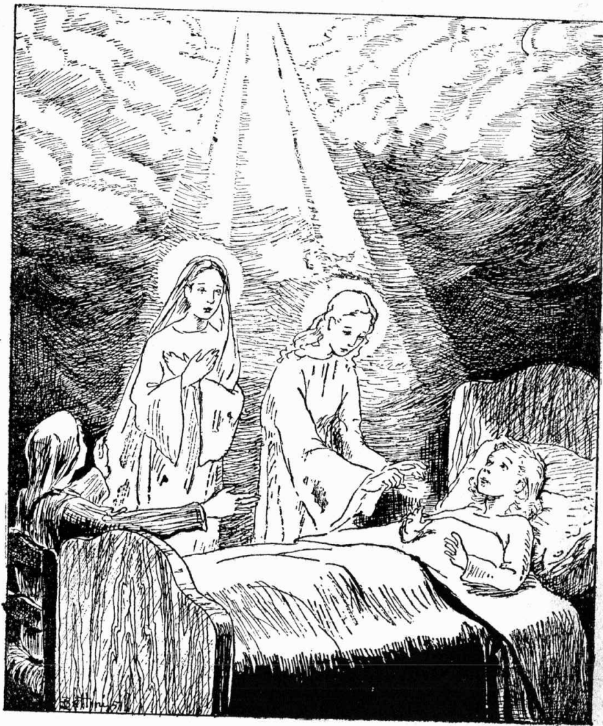
Ս. Հոփսիսմէ մօտեցաւ աղջնակին եւ կայծը դրաւ սրտին

Յետոյ երկարեց իր մատը եւ ազամանդի պէս գեղեցիկ կայծ մը թռաւ .