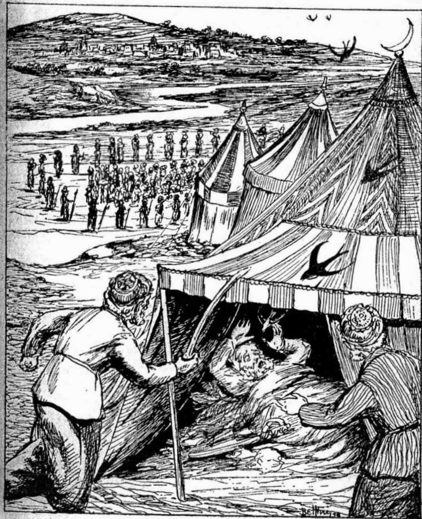
... եւ ծիծեռնակները խոյսցան քնացող մարդուն վրայ...

Ծիծեռնակները տակաւին կը շրջէին երկնքին մէջ. կ'ուղչին լուրեր հաւաքել, զգացումներ հասկնալ: Երեկոյեան մօտ բանակին մէջ մուսնետիկ ելաւ, թէ ըլլոր գերիները՝ այր թէ կին, ծեր թէ տղայ ազատ են զանաբար իրենց տուները: Երբ գիտուորները շղթաները բացին, դունապեղ բազմութիւն մը, ուրախ շարկան-