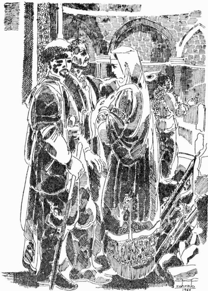
Երանի՛ այն ապգին որ քեզի պէս պատուաւոր ու քաջ պաւակներ ունի:

Ապա Գրիգորի նուիրեց ոսկեթել ձեռագործ մը, զոր ինք անձամբ բանած էր եւ անոր մէջ փաթեցած էր այն նշանաւոր Նահատակ վարդապետին ձեռագիրը: Ասոնց հետ նուիրեց նաեւ իր անձնական սպիտակ ձին: