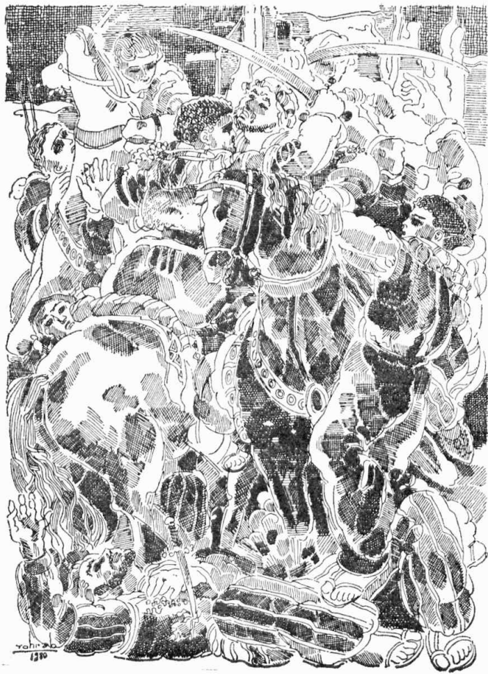
Առաջին յարձակողը դարձեալ Գրիգորն էր....:

քեզ ծեծող Ոսկի Գրիգորը ազատելու համար ու վատորէն անոր մահը խնդրեցիր քու թշնամիէդ. ահա Հայ գնդակէ ա՛ռ քու վախճանդ :