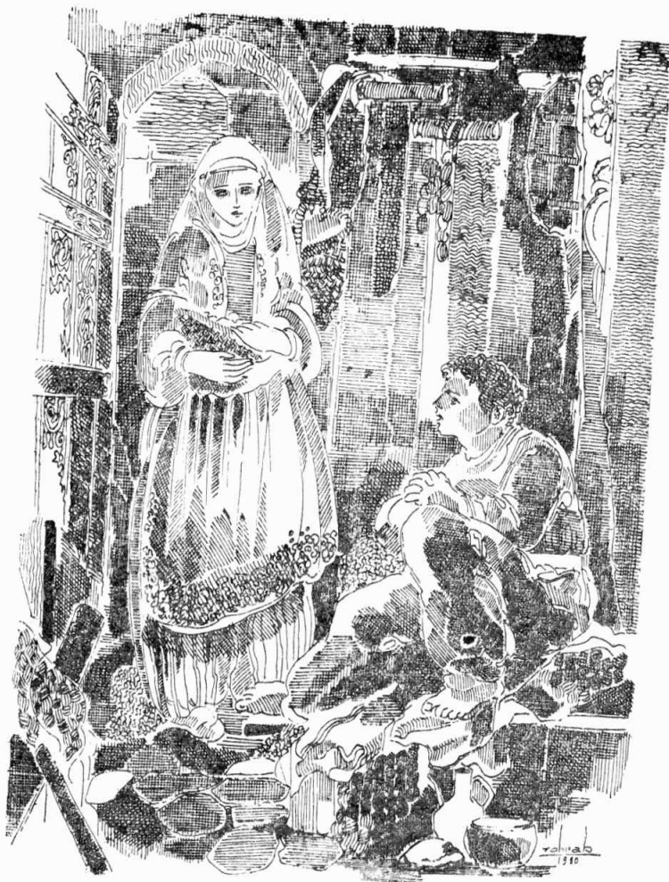
Հնորհակալ եւ, Սաթիա, Աստուած սրտիդ համաձայն տայ քեզի:

Օրեր վերջ Գրիգոր արձակուեցաւ բանտէն եւ Սուլէյման գինք կարգեց հովիւ իր հօտին: