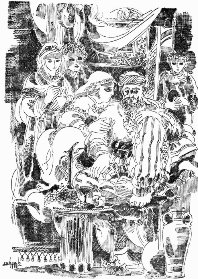
Արեւոյ չմարի, ինչո՞ւ չես մտածեր մեր Ոսկի Գրիգորի մասին....:

Գիշեր մը Սաթիա արթնցաւ: Պարզկայ ու լուսնակ գիշեր մըն էր: Աստղերը կարծես արծաթ կը ծորէին այդ օրը եւ լուսինը վերջալոյսի արեւուն պէս կը փայ- լէր: