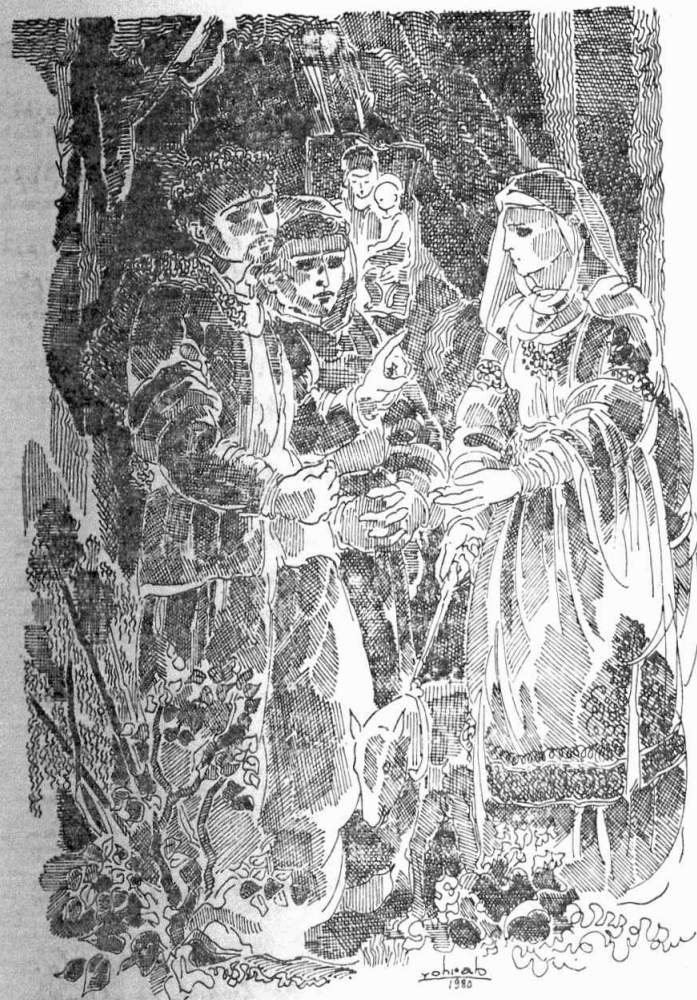
Ի՞նչ գործ ունիս այս կողմերը...