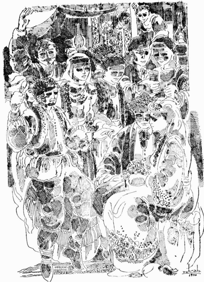
Ոսկի՛ Գրիգոր, ոսկեղէ՛ն օր։

Սակայն օրուան ամէնէն յուզիչ երեւոյթը այս չէր, այլ՝ Գրիգորի մէկ ագնիւ մտածումը։ Նա հաւաքել տուած էր գիւղին բոլոր աղքատները, Հայ թէ սուրիացի, եւ անոնց բաժնած էր կերակուրէ զատ զգեստ ու զրամ։