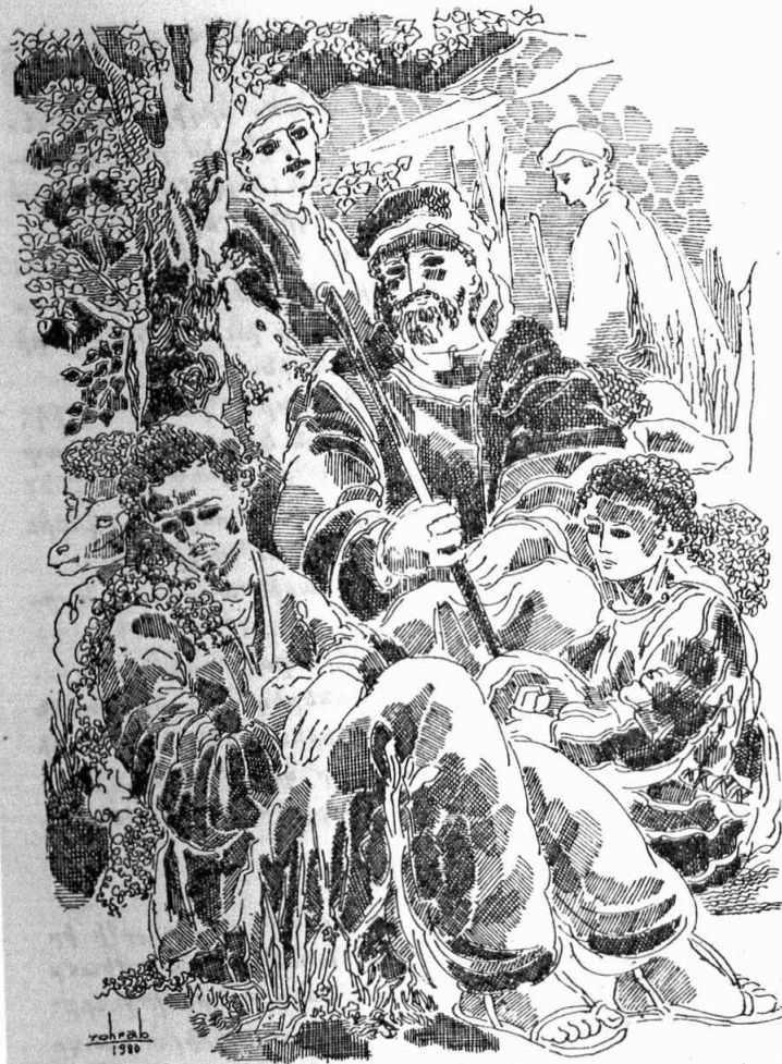
Ինչո՞ւ կու լաս, սիրուն տղաս, հարցուց աշուղը: