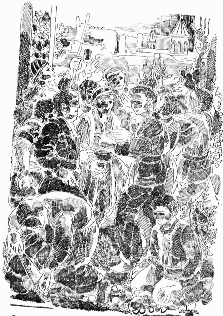
Ոսկի Գրիգոր պարսատիկին մէջ սուր քար մը վետեղեց եւ...

Թին տակէն ծիծաղեցաւ, Փլլիթիքոսի այս ծամուած պատառը կլլելուն վրայ... :