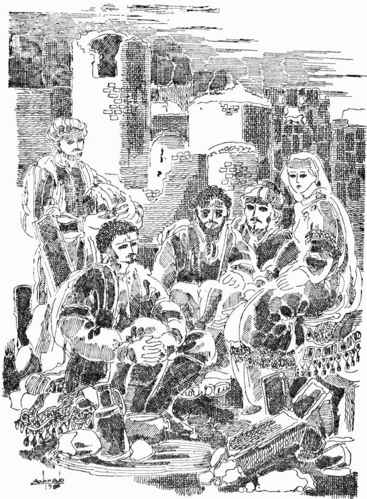
Միաները նստան մուտքի աշտարակներուն ստորոտը և ավտորժակով կերան ու խմեցին:

գեղարուեստի և մեր տաճարներու և պարիսպներու մասին: